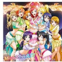
♪ Music S.T.A.R.T!!