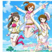
♪ sweet&sweet holiday