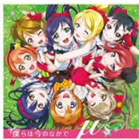
♪ 僕らは今のなかで

➤ 先行体験会でプレイ出来た6曲に加えて、「タカラモノズ」と「Angelic Angel」の2曲が追加！