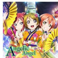
♪ Angelic Angel