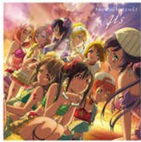
♪ Mermaid festa vol.1