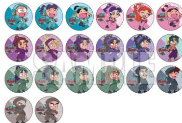
サイズ：直径約44mm ブラインドパッケージ1袋1個入れ

©尼子騷兵衛/NHK・NEP ※画像はイメージです。実際の商品と異なる場合がございます。