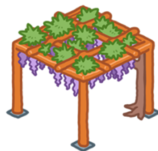
春日部市の花 『藤の木』