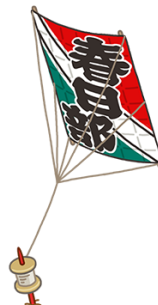
春日部市の名産品 『大凧』