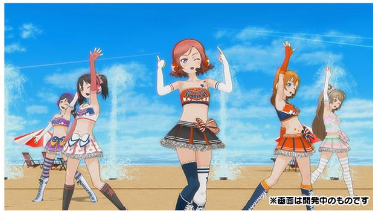
♪ 夏色えがおで 1,2,Jump!