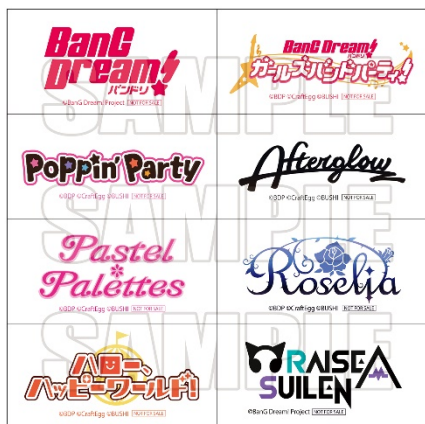
▲バンドロゴステッカー