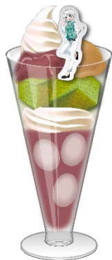
イヴの和おもてなし和風パフェ