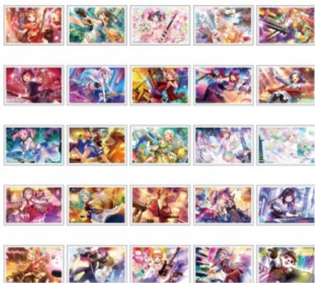
スクエア缶バッジ（全25種）