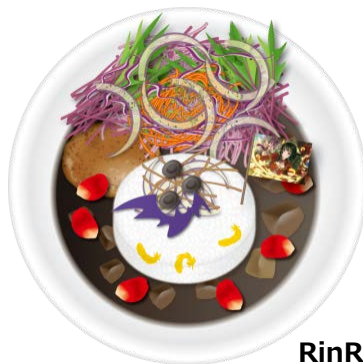
RinRinと聖墮天使あこ姫の 深淵の闇より出でしブラックカレー(‘ω’)/