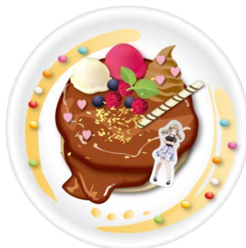
有咲のほんとは嬉しい(?) 友チョコパンケーキ