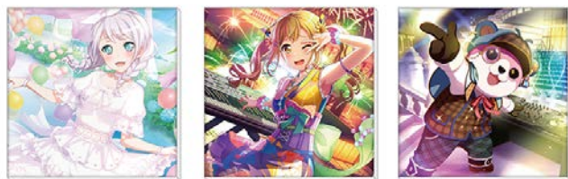
キャンバスアート（全5種）