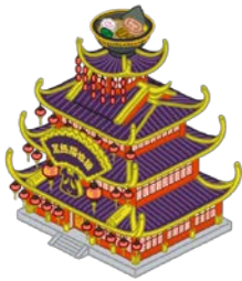
ブラックパンダラーメン 本店