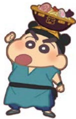
＜防衛隊＞ どんぶりしんちゃん