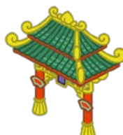
アイヤータウンの門