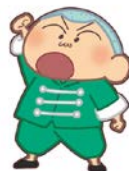
カンフーマサオくん