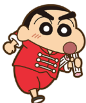
▲ちょ～激レア カンフーしんちゃん

4月13日(金)より公開中の『映画クレヨンしんちゃん 爆盛！カンフボーイズ～拉麺大乱～』より、作品をイメージしたステージ・コスプレ・おとの配信することをお知らせ致します。このステージでは、劇中で登場したブラックパンダのヘイヘイが“てき”として出現します。また、ちょ～激レア「カンフーしんちゃん」激レア「どんぶりしんちゃん」のコスプレと激レア「ラン」のおともを配信いたします。映画世界観を思う存分楽しめる仕上がりになっておりますので、映画と一緒にカスカベランナーをお楽しみください！