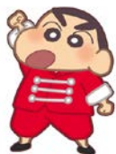
カンフーしんちゃん